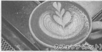
カフェラテ(ホット)